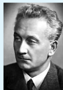
Albert von Szent-Györgyi